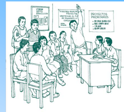
Ilustración tomada de: Guía del presupuesto participativo Por resultados Proyecto USAID/Perú --- ProDescentralización-enero 2011

Para poder participar, las instituciones en el plazo de ley, deben ser inscritas en los padrones que aperturan los gobiernos regionales y locales; y sus representantes deben estar debidamente acreditados para participar en el proceso. Aquellos que se incorporen pero que no han sido acreditados por sus organizaciones en el plazo respectivo, participarán pero en calidad de observadores.